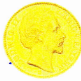
Bayernkönig Ludwig II.