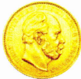
Deutscher Kaiser Wilhelm I.